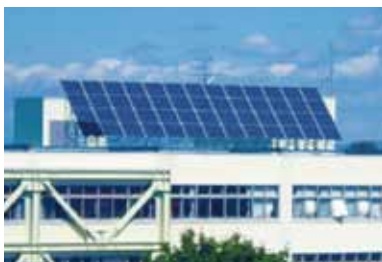
▲小学校屋上に設置した太陽光発電設備

現在、当社では再生可能エネルギー分野の普及・拡大に伴い、太陽光発電設備工事の積極的な受注活動を展開しています。