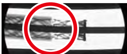
◀ 端末ケーブルの断線箇所

当社では、工業用レントゲン装置の導入により端末ケーブル遮弊層の断線等を発見することで、事故の未然防止に努めています。